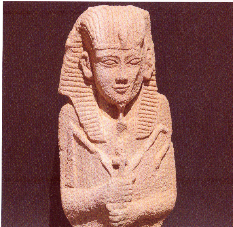
Königsstatue von der Widerallee des Amun-Tempels in Naga, 1. Jh. n. Chr.

Eine der alten Königsstädte aus dem Land der schwarzen Königinnen, dem meroitischen Reich auf dem Gebiet des heutigen Sudan, ist im Rahmen eines Grabungsprojektes aus dem Wüstensand freigelegt worden. Als Bilanz von 15 Jahren Feldforschung zeigt das Ägyptische Museum die Sonderausstellung Königsstadt Naga – Grabungen in der Wüste des Sudan , deren 130 Objekte als Leihgaben des Sudan direkt aus Naga nach Deutschland gekommenen sind. Die an der Grabung beteiligten Archäologen erläutern in der Vortragsreihe die Statuen, Reliefs und Architekturteile in ihrer Brückenfunktion zwischen Afrika und der Mittelmeerwelt und entwickeln aus diesen Neufunden ein repräsentatives Bild der Kunst, Religion und Kultur des meroitischen Reiches im 1. Jahrhundert n. Chr. Die Ausgräber schildern ihren Grabungsalltag in der Wüste, geben Einblick in die Hochtechnologie, die für Dokumentation und Restaurierung eingesetzt wurde und thematisieren die Rolle der Archäologie für die historisch-kulturelle Identität des modernen Sudan.